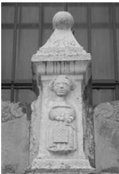
7. Cerkev sv. Valentina v Črnem Kalu, detajl nekdanjega glavnega portala cerkve sv. Lovrenca, 1680