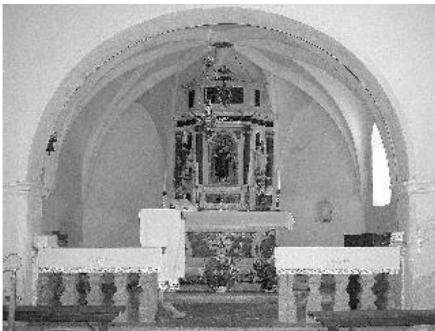
13. Cerkev sv. Martina v Zazidu, obok v prezbiteriju, kon. 17. stol.