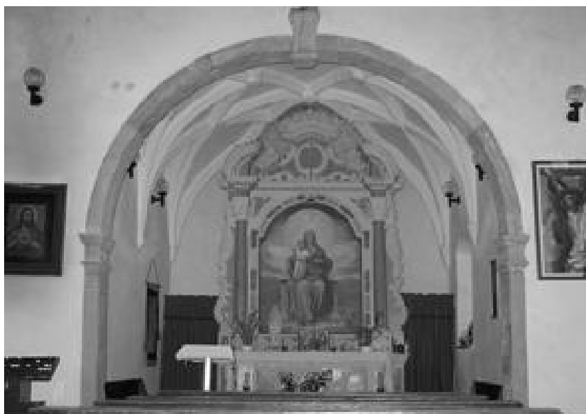
2. Cerkev Marije Snežne na Gradišci pri Črnotičah, obok v prezbitoriju, 1663-1665