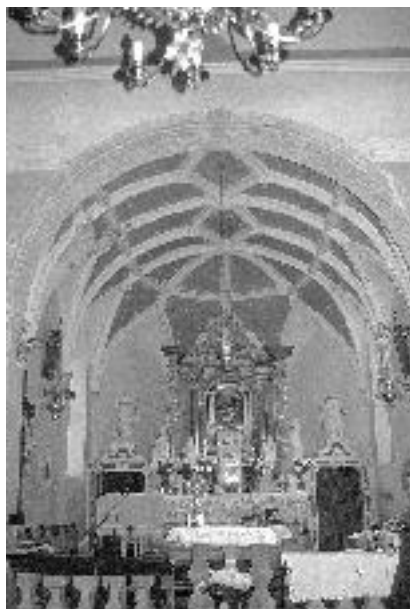
9. Cerkev sv. Trojice v Rodiku, obok v prezbitериju, 1647