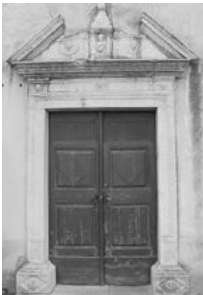
5. Cerkev sv. Petra v Klancu, portal, 1670