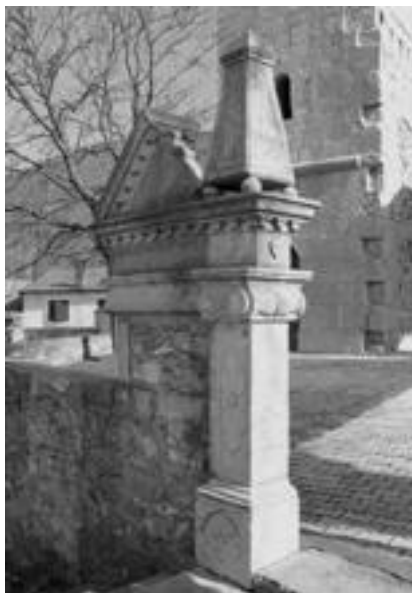
10. Cerkev sv. Trojice v Rodiku, del zahodnega portona, 1667