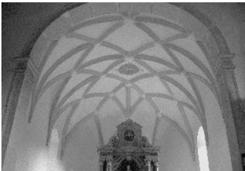
4. Cerkev sv. Petra v Klancu, obok v prezbitteriju, 1659