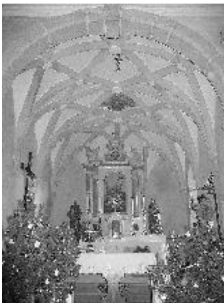
1. Cerkev sv. Elija v Mihelah, obok v prezbitoriju, 1663-1670