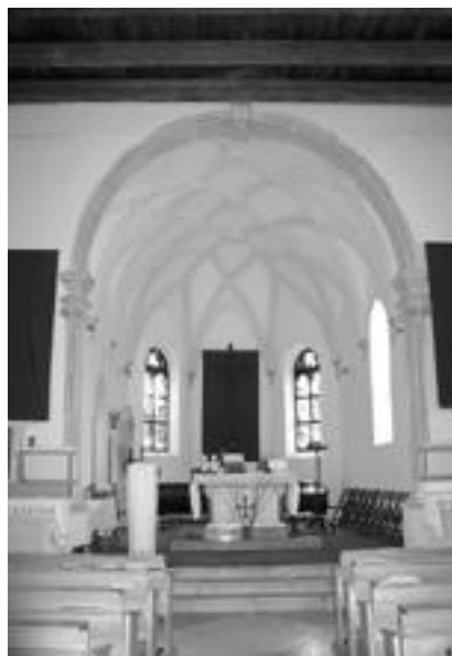
6. Cerkev sv. Janeza Krstnika v Predloki, obok v prezbitteriju, druga pol. 17. stol.