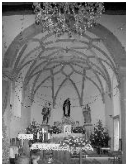
12. Cerkev sv. Antona v Hrpeljah, obok v prezbiteriju, zač. druge pol. 17. stol.